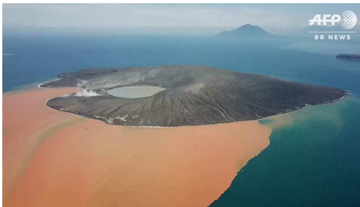
噴火後のアナクラカタウ火山(AFP ウェブサイトより)。山体のほとんどがなくなっていることがわかる。