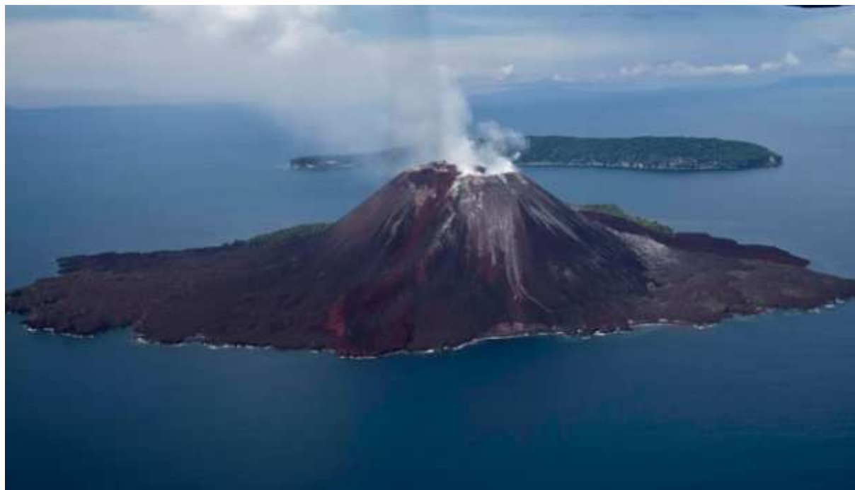
噴火前のアナクラカタウ火山